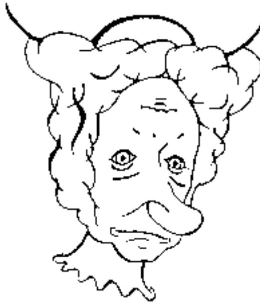
図4 老婆と王女 (Kanizsa 1979 より)

その他に、枠組みによって見え方が異なることを劇的に体験する絵として図4があります。テキストをこのまま見れば「老婆」に見えますが、このテキストを逆さにして一度見てください。