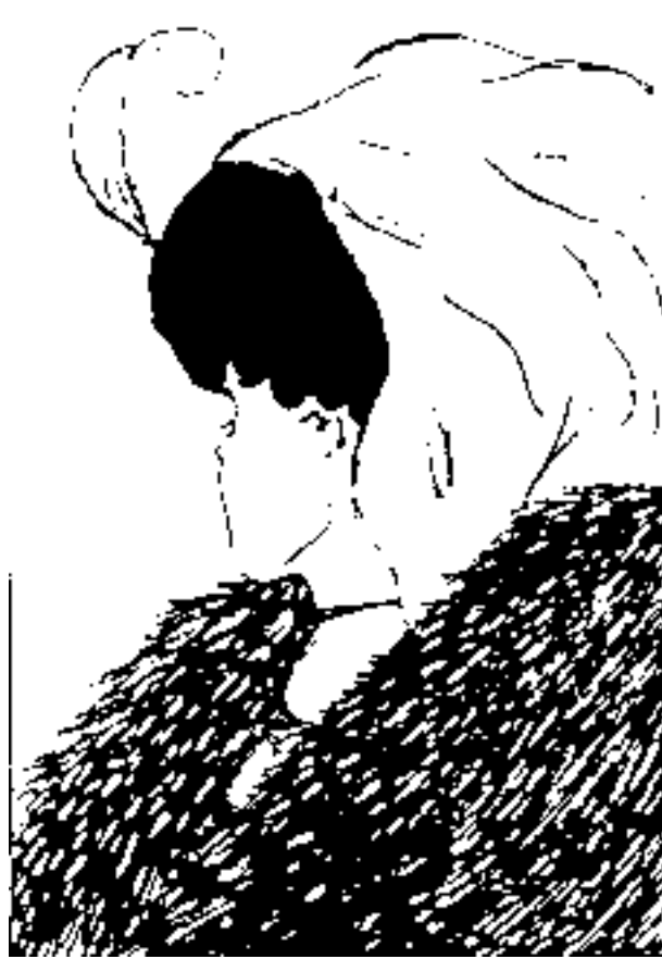
図2 老婆と若い女性

意味的反転図形の有名な絵に図2があります。読者の方は、この図2で何が見えていますでしょうか。タイトルにあるように、若い女性か老婆が見えるはずですが。挑戦してみてください。ただ、一度あるものに見えてしまうとなかなかその他の異なるものを見つけ出すことができないといったことも私たちの見る特徴としてあります。一度でき上がった偏見がなかなか修正できないなどといったこともこのようにことから類推することができます。