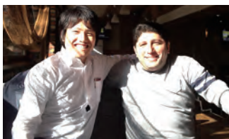
ウズベキスタンでお客様と

卒業後は繊維機械を製造、販売する事業部で働いています。多くのお客様が新興国に居を構えていることもあり、入社後7年間に在籍していた営業部では1年の半分程を海外で過ごしてまいりました。今は企画部門においてインドを中心とした関連会社との業務が中心です。文化、背景の違う方たちとの業務は難しいことも多くありますが、大切なことは一緒です。相手の状況を正しく理解して、自分で考え、伝える言葉で伝えること。久しぶりに恩師に会うチャンスが来た時に「君は大学時代からアウトプットの質が変わってないんじゃないか?」だなんて言われぬように、今も精進の毎日です。