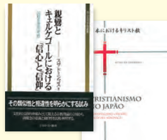
筆者の著書 『親鸞とキェルケゴールにおける「信心」と「信仰」』 『日本におけるキリスト教』

たり、自分の主義をただ正当化するだけのために用いられたりすることもあり得るからです。これまでも比較思想は、しばしば他の伝統の劣勢と自己の伝統の優位を示すために、用いられてきたこともありました。多様な価値観が存在する現代において、諸思想や諸文化・宗教のそれぞれ独自の立場を保持しながら、如何に対話や相互理解を推進すればいいのかは、極めて重要な課題であります。結局のところ、諸宗教・諸文化間の対話や相互理解は、理論的に解明すべき問題ではなく、実践的な課題であると言えます。