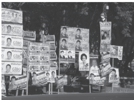
イロイロ市での国政選挙候補者のビラ

滞在中は，各党の正副大統領候補者ならびにその上院候補者（全国区 12 名）のほとんどがフィリピン全国を地方遊説にでており，マニラ首都圏には不在であったのは残念であった。しかし候補者選定または候補者出馬問題のテーマは今後も引き続き調査していく考えである。